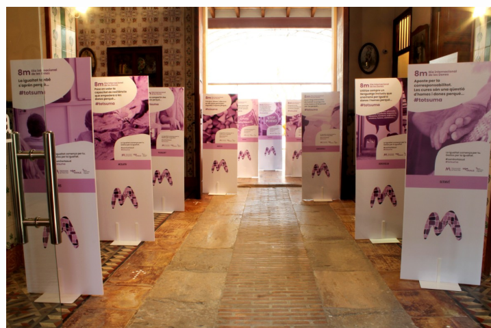
Exposició Gestos per la igualtat